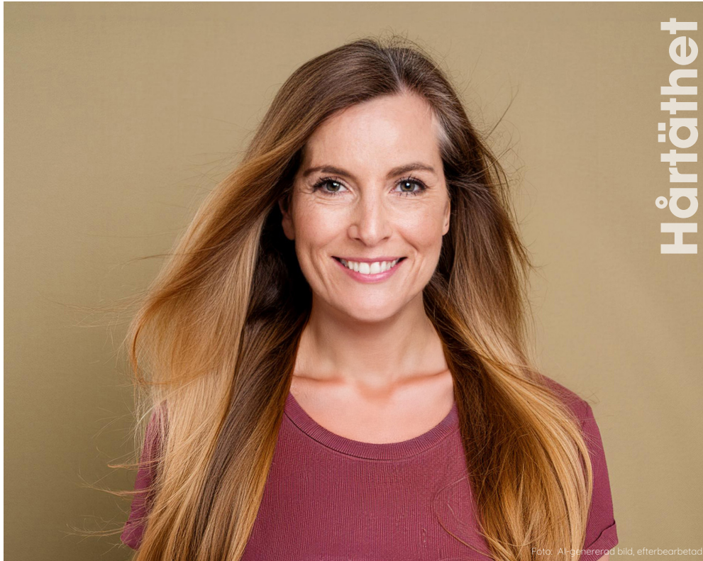
Foto: AI-genererad bild, efterbearbetad