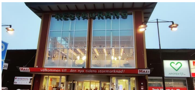
ICA Maxi Skellefteå