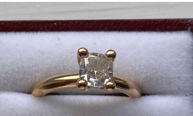
1,3 carats diamant utvunnen av Africa Resources i DRC hösten 2021