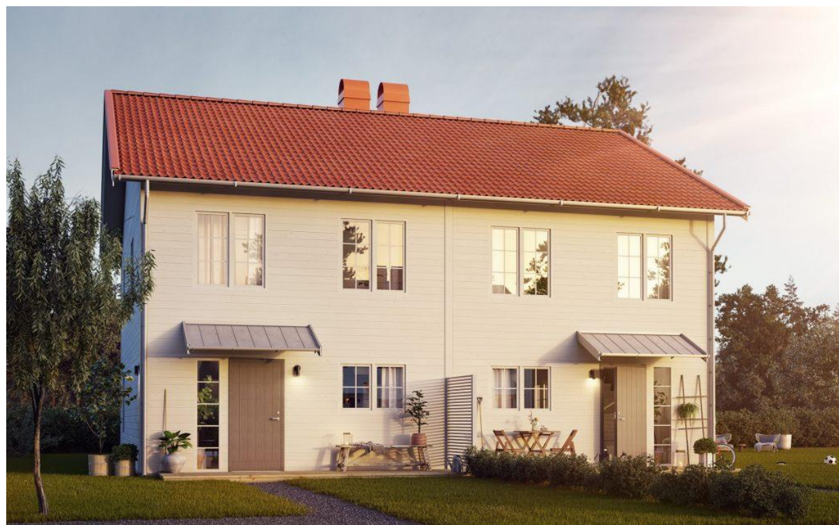
Brf Englamarken i Skoklister