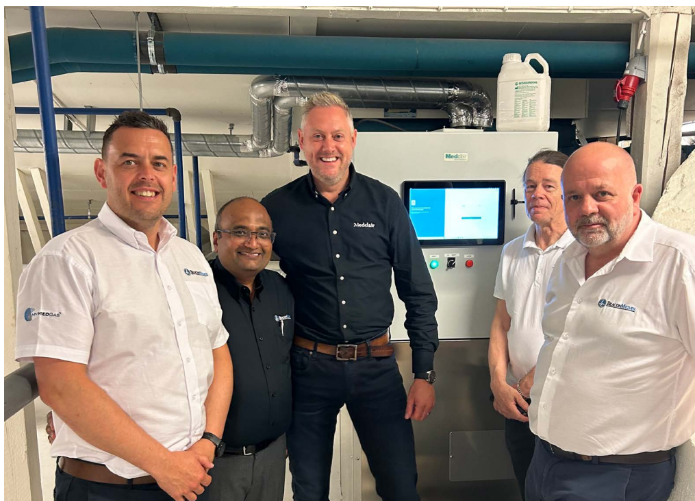
BeaconMedgas besökte Medclair under tre lärorika dagar där, en viktig framgångsfaktor är våra skickliga partners.