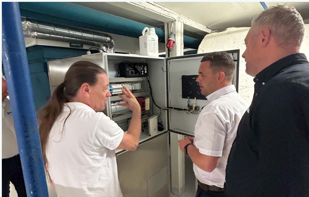
Våra distributörer erbjuds ett utbildningsprogram för installatörer och tekniker, här visar vi en anläggning installerad i Stockholm.