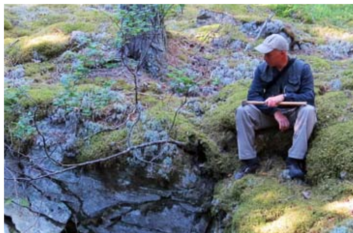
På många platser i Sverige påträffas gamla gruvhål och skärpningar som ofta blivit kulturminnesförklarade.