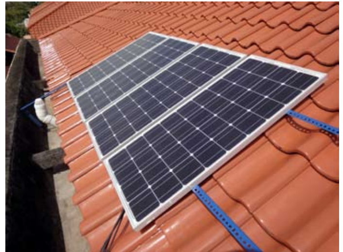
Renewable Ventures Nordic har nyligen investerat i ett bolag inom solenergi-sektorn.