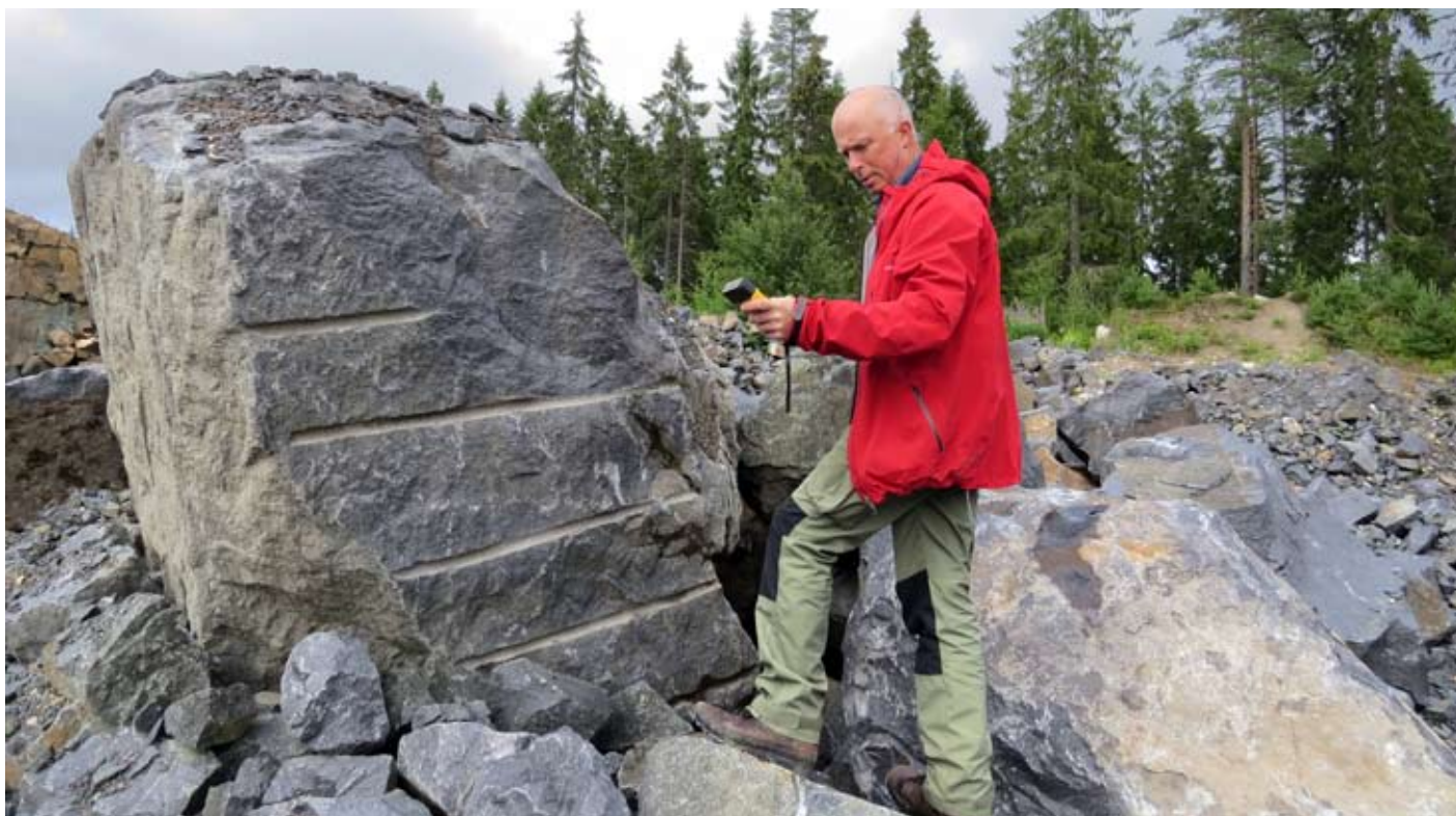
Gamla gruvområden ger värdefull information om bergarter och mineraliseringstyper.

Archelon utvärderar fortlöpande nya projekt där mineralprospektering är en viktig del. Syftet är att skapa tillgångar som efter värdetillväxt ska kunna realiseras under ordnade former. Viktiga kriterier är att projektet eller bolaget ska vara lämpligt för utdelning och ha tillräcklig substans för efterföljande listning på en marknadsplats för aktiehandel. I samband med introduktion av nybildade bolag strävar Archelon alltid efter att tilldela aktieägarna ett direktäggande.