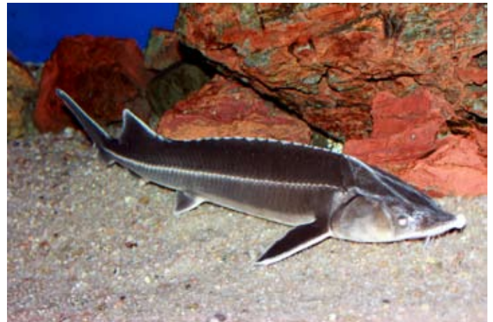
Stören är en broskfisk till skillnad från de fiskar vi normalt kommer i kontakt med i våra hav, sjöar och vattendrag. Ingen risk att man får ett fiskben i halsen när man äter stör, som också är en god matfisk.