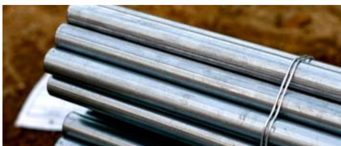
Nickel ingår som legering vid framställning av rostfritt stål.

Det första steget i att bevisa innehållet i tillgången var att erhålla registrering av resurser enligt rysk C3-standard, anmälan lämnades in under 2014 vilket senare godkändes och registrerades den 1 januari 2015 enligt följande: