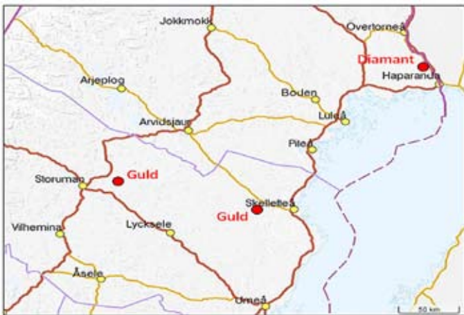
Översiktskartan visar Goldores undersökningstillstånd.