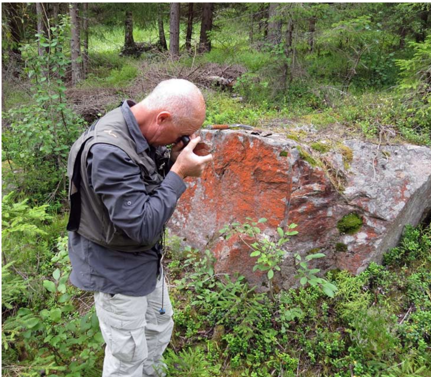
Vid fältkartering kommer en lupp ofta till användning.

teckningsrätter. Därutöver har Archelons styrelseordförande och verkställande direktör lämnat teckningsförbindelser (personligen samt genom bolag) att teckna sin pro-rata andel i Nyemissionen motsvarande ca 0,625 MSEK. Nyemissionen är därmed per dagen för Memorandumets offentliggörande garanterad genom teckningsförbindelser och garantier till ett belopp om cirka 4 MSEK eller ca 78 procent. Dessa förbindelser och garantier är inte säkerställda genom panstättning, spärmedel eller likande arrangemang. Motparten är dock medveten om att detta avtal innebär juridiskt bindande förpliktelse gentemot Bolaget och förpliktar sig att hålla erforderliga medel tillgängliga för det fall emissionsgarantin skall tas i anspråk. Det föreligger dock en risk att garantiåtagandet inte fullgörs i sin helhet vilket skulle kunna inverka negativt på Bolagets möjligheter att erhålla det garanterade beloppet. För mer information om garantiåtagandet och teckningsförbindelser, se avsnittet "Villkor & Anvisningar".