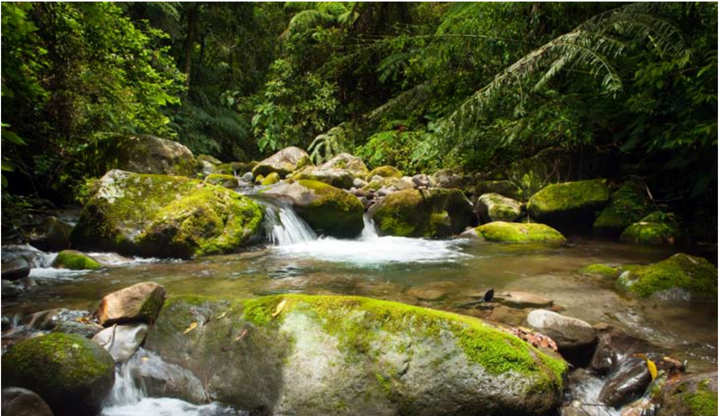
Archelon följer gruvbranschens riktlinjer för god miljöpraxis vid prospektering.