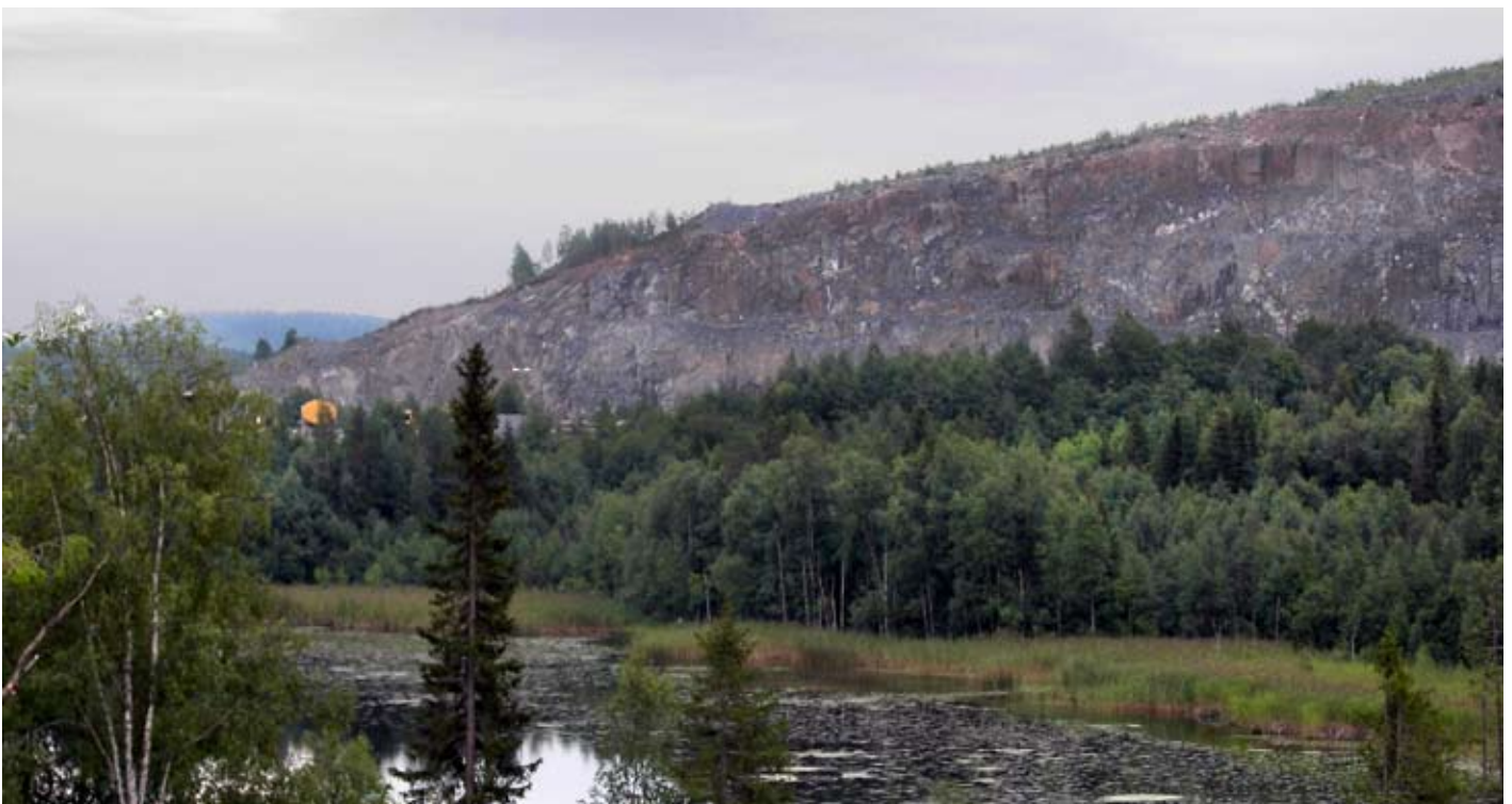
Björkdalsgruvan är en av norra Europas största gruvor för utvinning av guld. I samma region har Goldore undersökningstillstånd för guld.