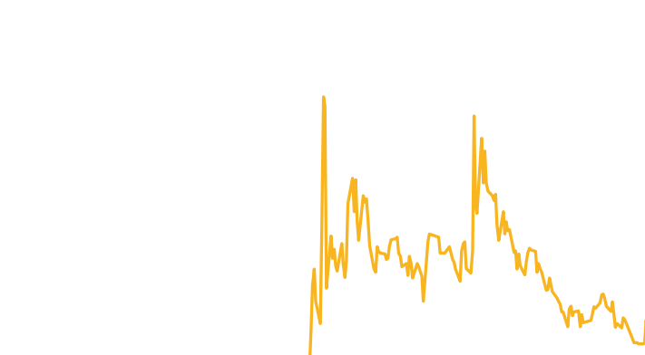
Omsatt antal aktier

1,60 kr 1,40 kr 1,20 kr 1,00 kr 0,80 kr 0,60 kr 0,40 kr 0,20 kr 0,00 kr