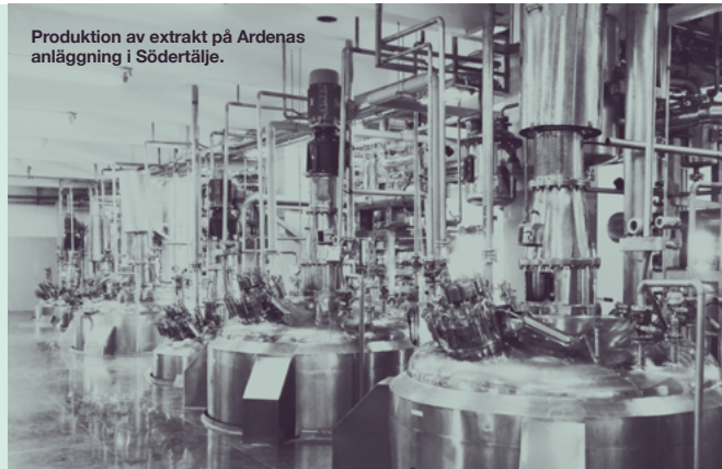
Produktion av extrakt på Ardenas anläggning i Södertälje.