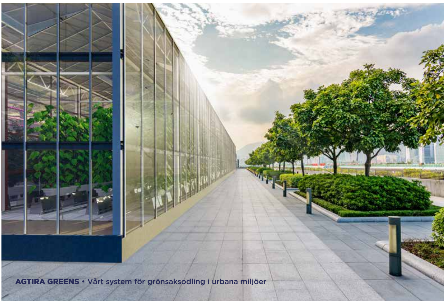
AGTIRA GREENS • Vårt system för grönsaksodling i urbana miljöer