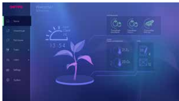
PICS - Agtiras AI-baserade styrsystem

dem börjar närma sig en punkt där vi kan påbörja arbetet med patentsökningar. Både inom akvaponi och vertikalodling har vi kandidater till patentansökningar som just nu utvärderas internt.