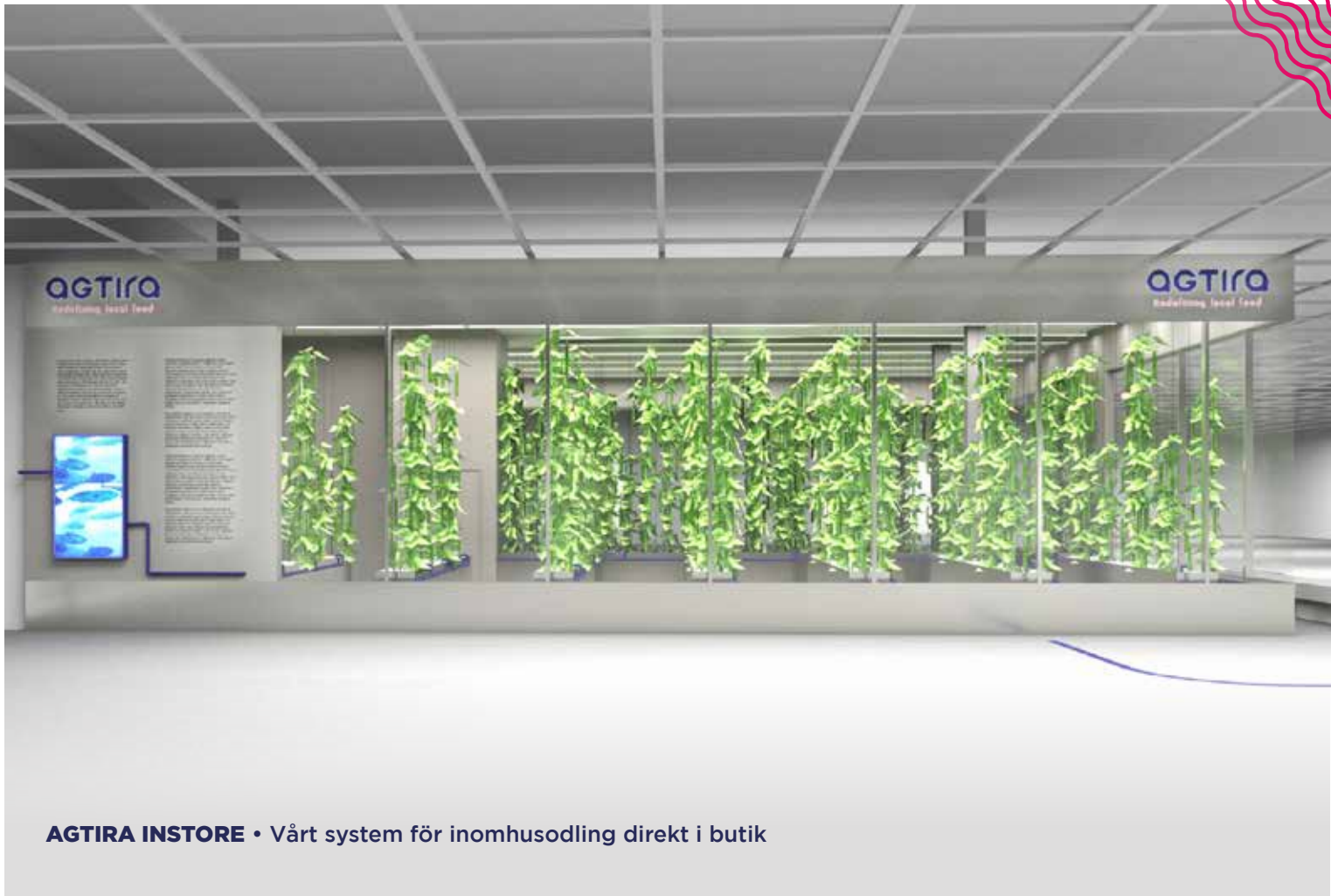
AGTIRA INSTORE • Vårt system för inomhusodling direkt i butik