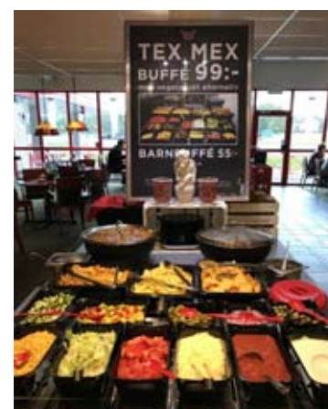
Tex Mex på Rasta