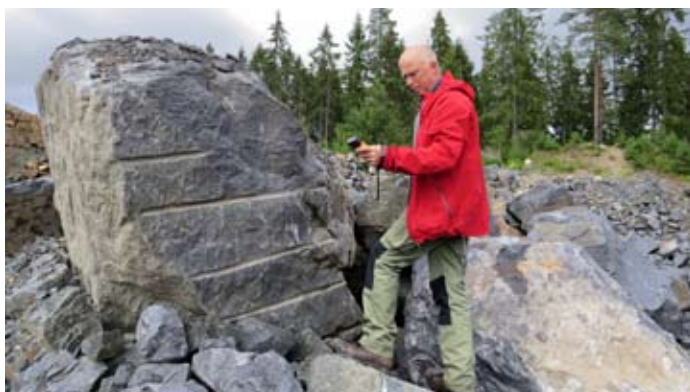
Omslagsbild: Gamla gruvområden ger värdefull information om bergarter och mineraliseringstyper.