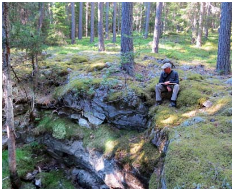
Prospektering efter basmetaller i Värmland.

Archelon arbetar fortlöpande med att utvärdera nya projekt där mineralprospektering är en viktig del. Syftet är att skapa tillgångar som efter värdetillväxt ska kunna realiserars under ordnade former. Viktiga kriterier är att projektet eller bolaget ska vara lämpligt för utdelning och ha tillräcklig substans för efterföljande listning på en marknadsplats för aktiehandel. I samband med introduktion av nybildade bolag strävar Archelon alltid efter att tilldela aktieägarna ett direktäggande.