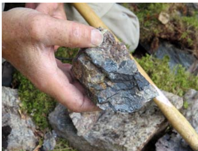
Inom ARD's koncessionsområde har påträffats mineraliseringar med höga guldhalter.