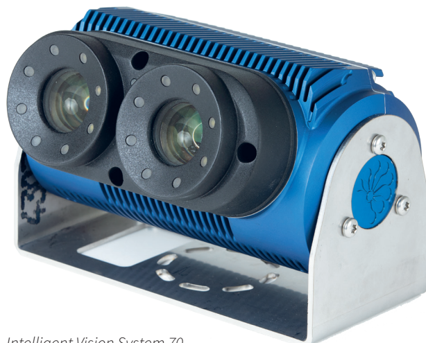
Intelligent Vision System 70.

Unibap har introducerat och designat flera generationer AI-hjärnor tillsammans med AMD®. Produkterna använder sig av samma teknik som bland annat Sony och Microsoft använder i sina senaste spelkonsoller, men där Unibaps AI-hjärnor även har en förstärkt och utökad felkorrektion tack vare AMDs adderade serverprocessorfamiljer. Den heterogena arkitekturen kombinerar således fördelar från två tekniker i syfte att utföra parallellberäkningar med höga säkerhetskritiska krav vilket kräver hög tillförlitlighet.