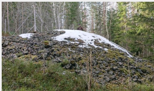
En mindre varphög på Kallmora nr 3. Ej samma som i texten.

Inom kort kommer bolaget påbörja arbetet med att ansöka om miljötillstånd för att processa varphögen hos Norberg kommun (Anmälan om miljöfarlig verksamhet). Parallellt med ansökningsprocessen kommer bolaget upphandla tjänster gällande grävmaskin, krossverk samt transporter till anriktningsverk. Initiala kontakter har tagits med anriktningsverk för att utvinna metallerna ur stenarna i varphögen.