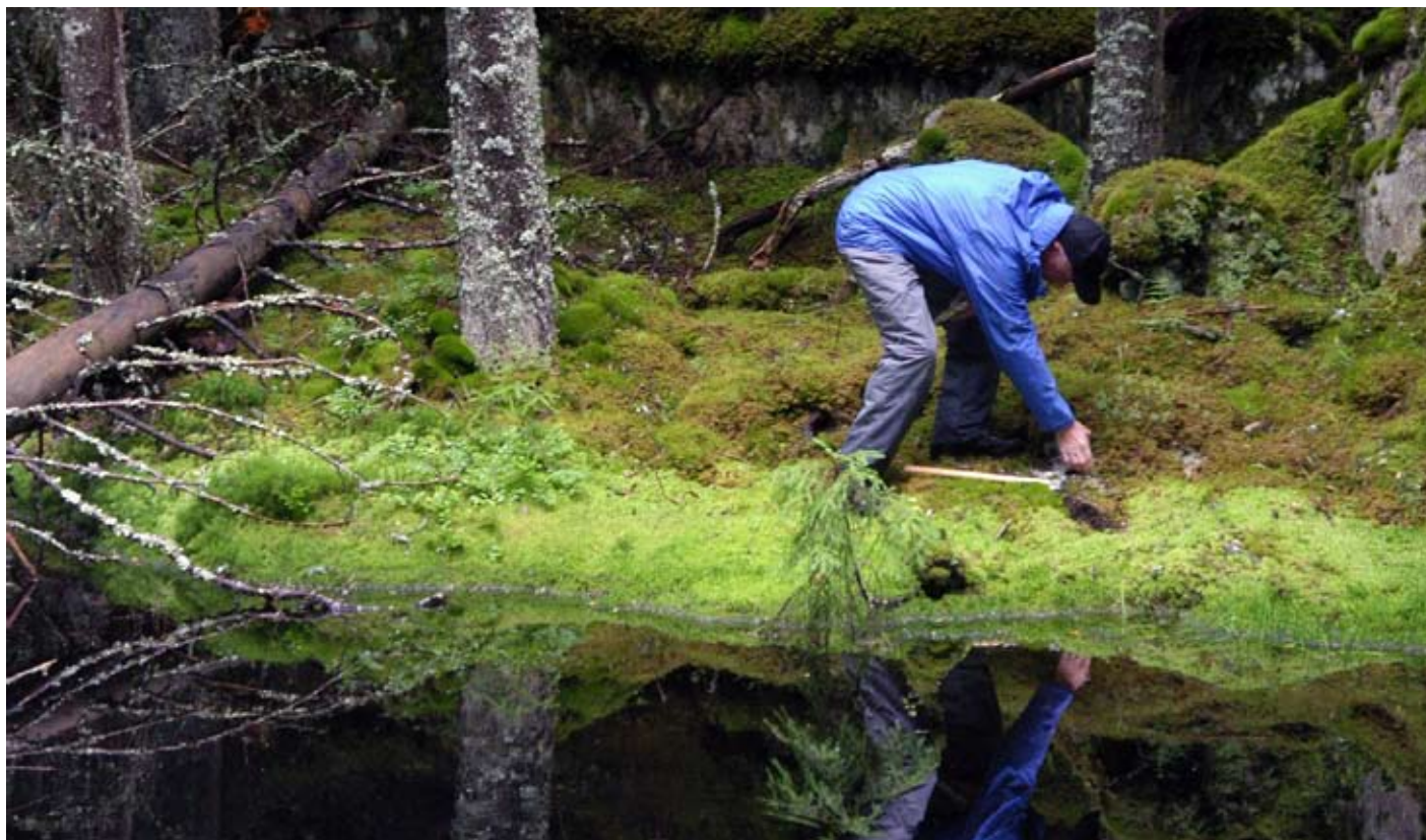
Archelon följer gruvbranschens riktlinjer för god miljöpraxis vid prospektering.