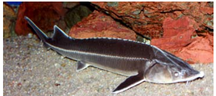
Arctic Roe avser att producera exklusiv rom från stör.

Under 2016 har Archelon även investerat i Arctic Roe of Scandinavia AB, ett företag inom segmentet vattenbruk som bygger upp en anläggning för produktion av "rysk kaviar" från stör i egna odlingar belägna i småländska Strömsnäsbruk. Verksamheten är tillståndspliktig och ett sådant har medgivits från Länsstyrelsen i Kronobergs län. Aktien i Arctic Roe är onoterad. Archelons ägande uppgår per sista mars 2017 till dryga 5 procent.