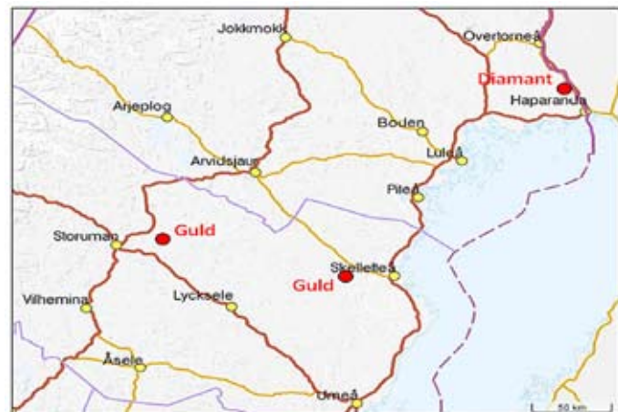
Översiktskartan visar Goldores undersökningstillstånd.

Bolaget kommer i ett inledande steg att samla in, sammanställa och tolka befintlig geologisk information. Utifrån detta upprättas arbetsplaner för de prospekteringsarbeten som bolaget avser att utföra på de två guldmotningarna.