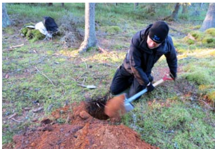
Moränprovtagning tillför kunskap om den underliggande berggrundens sammansättning och är en viktig del i prospekteringsarbetet.

Archelon arbetar fortlöpande med att utvärdera nya projekt där mineralprospektering är en viktig del. Syftet är att skapa tillgångar som efter värdetillväxt ska kunna realiseras under ordnade former. Viktiga kriterier är att projektet eller bolaget ska vara lämpligt för utdelning och ha tillräcklig substans för efterföljande listning på en marknadsplats för aktiehandel. I samband med introduktion av nybildade bolag strävar Archelon alltid efter att tilldela aktieägarna ett direktägande.