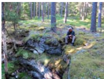
Prospektering efter basmetaller i Värmland.