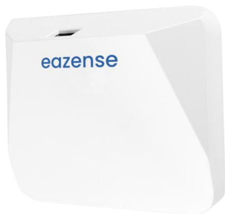
Produktbild av EaZense™

Under 2021 utvecklades en offline-version av EaZense™ i samarbete med den nederländska partnern Croonwolter & Dros, specialanpassad för kriminalvården. Bolaget ser en stor efterfrågan för denna tjänst globalt. Under det tredje kvartalet erhöles ett patent för delar av Bolagets radarsensor i USA och Raytelligence passerade sitt försäljningsmål om 1 000 enheter. I samband med detta sattes ett ytterligare mål att uppnå försäljning motsvarande minst 10 000 enheter år 2022. Raytelligence flyttade under året till en större lokal i Halmstad och etablerade flera nya partnerskap globalt. Bolaget bedömer att de därigenom har främjat förutsättningarna för 2022 års uppskalning och expansion, samt försäljning.