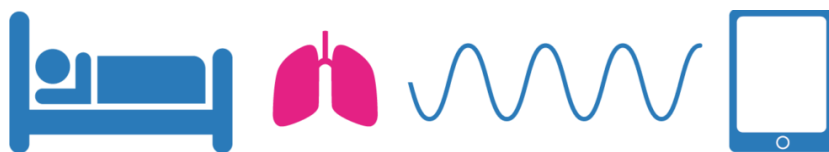
Komfort, säkerhet och integritet med EaZense™

Utöver hälsosektorn finns möjlighet för Bolaget att leverera teknik baserat på sensorn till andra kunder som är i behov av att kunna övervaka personer i arbete. Bolagets sensorteknik inom detta område kan bidra till en förhöjd säkerhet på t.ex. byggarbetsplatser.