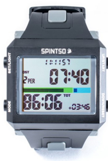
Spintso Ref Watch Pro black/gray