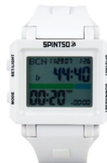
Spintso Ref Watch2S solid white