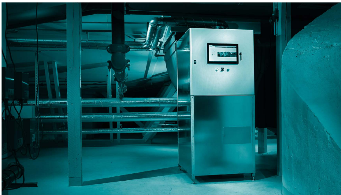
Central destruktionsenhet (CDU).