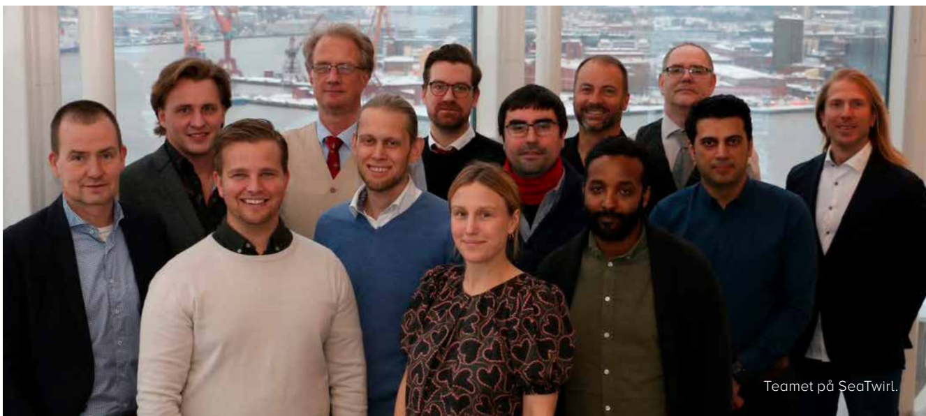
Teamet på SeaTwirl.

SeaTwirl har sitt säte i Göteborg med post- och besöksadress Lilla Bommen 1, 411 04 Göteborg.